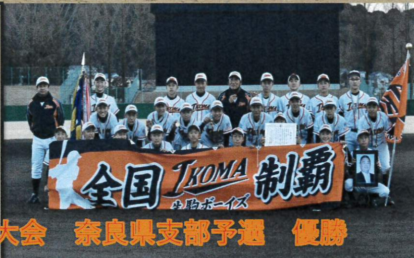
春季全国大会 奈良県支部予選 優勝